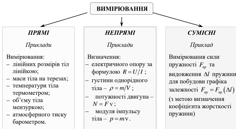
Рис. 1.2. Класифікація вимірювань за способом отримання числового результату

Як оцінити межі абсолютної \Delta та відносної \varepsilon похибок? У першу чергу це залежить від способу отримання числового результату, за яким вимірювання поділяють на прямі , непрямі (посередні) та сумісні (рис. 1.2).