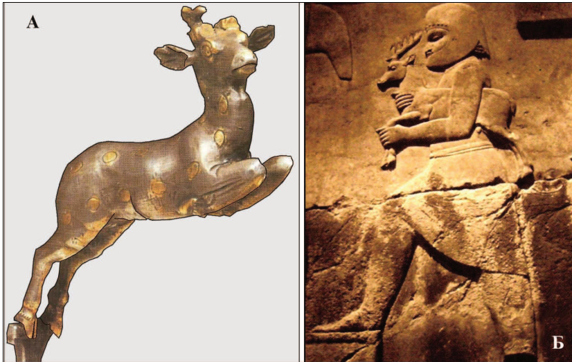
Мал. 1.2 Золота фігурка лані із Ірану (А) та барельєф чоловіка з ланню із Месопотамії (Б)

У V-III тисячоліттях до нашої ери на землях Великого Євразійського Степу панували скіфи. У розкопках їх поселень та могильників було знайдено багато кісткових артефактів та предметів побуту, які свідчать про існування у цього кочового народу розвинутих землеробства та тваринництва. В період з 105 р. до н.е. по 404 р. н. е. на значному просторі Римської імперії були поширені гладіаторські бої, у яких, окрім людей, використовували диких биків, слонів, носорогів, левів, тигрів та інших тварин. Звісно, що їх треба було утримувати в неволі, що сприяло накопиченню елементарних знань та формуванню навичок щодо розведення.