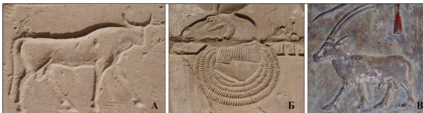
Мал. 1.1 Зображення копитних у древньому Єгипті: А – священний бик; Б – священний баран у Карнакському храмі; В – орикс у храмі царіці Хатшепсут

Досить важливою для одомашнення диких копитних виявилась територія сучасного Ірану – країни давньої і високорозвиненої цивілізації. На рубежі IV-III тис. до н. е. основним заняттям його жителів на рівнині, яка зрошувалася річками, що впадали до Перської затоки, було землеробство, а у горах – скотарство. Рясні врожаї ячменю у поєднанні з травами заплавних лук давали можливість вигодовувати значну кількість великої рогатої худоби, коней та овець.