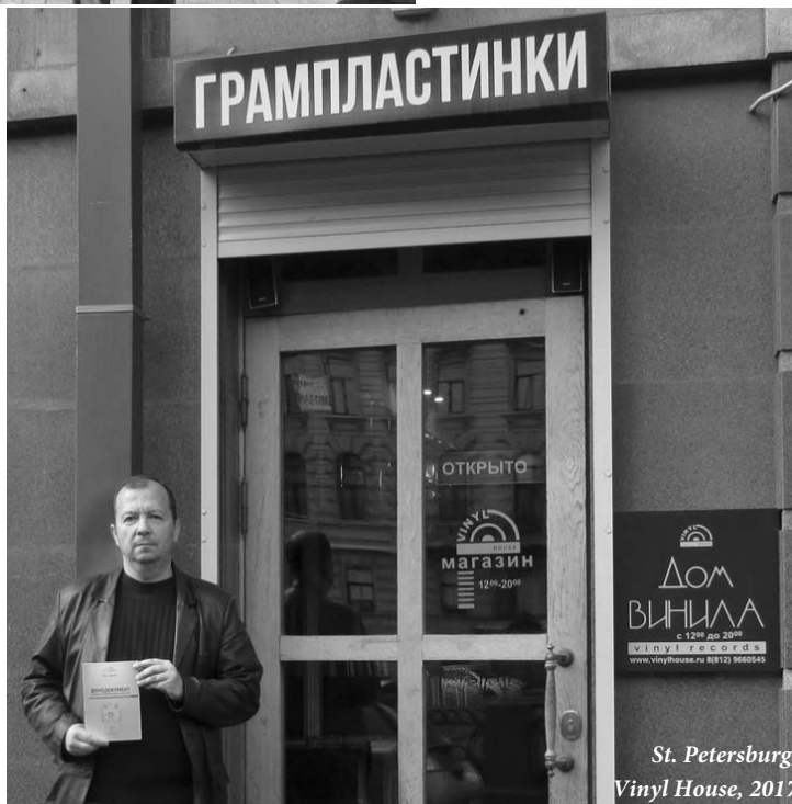
St. Petersburg, Vinyl House, 2017