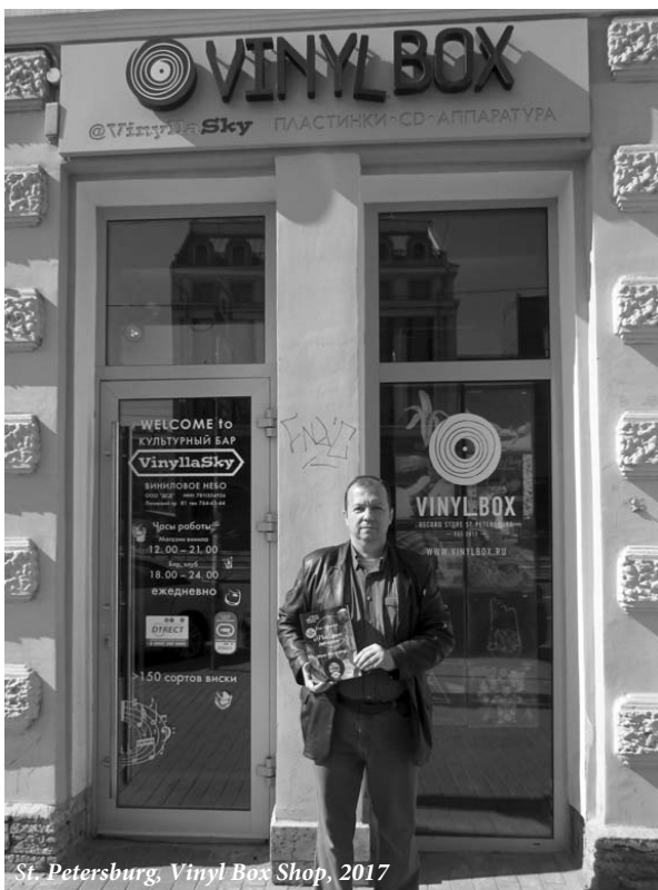
St. Petersburg, Vinyl Box Shop, 2017