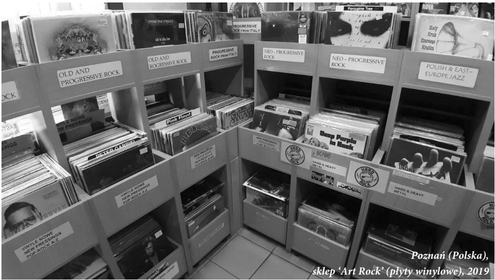
Poznań (Polska), sklep 'Art Rock' (płyty winylowe), 2019