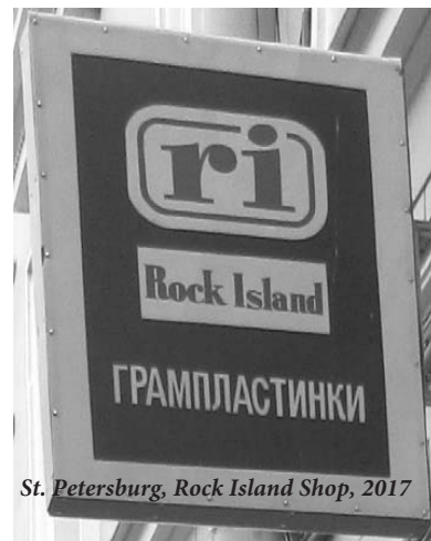
St. Petersburg, Rock Island Shop, 2017