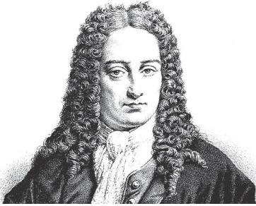
Рис. 1.1. Основоположник механістичного підходу Готфрід Вільгельм Лейбніц