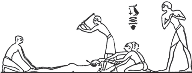
Рис. 1.4. Покарання неплатників податків у Стародавньому Єгипті

Згідно зі ст. 6.1 Податкового кодексу України податком визнається «обов'язковий, безумовний платіж до відповідного бюджету, що справляється з платників податку».