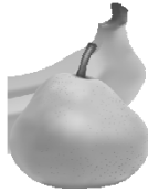
Це гру́ша. Це бана́н. Це гру́ша та бана́н.

Зараз урок. Це зо́шит. А це моя кни́жка. Журна́л тут.